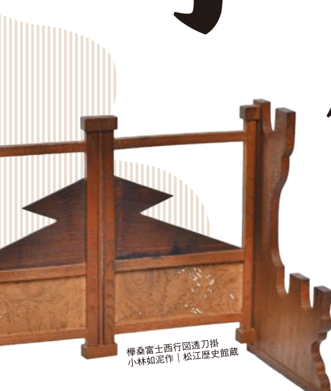
榊桑富士西行園透刀掛 小林如泥作 | 松江歴史館蔵