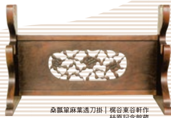
桑瓢箪麻葉透刀掛 | 堀谷東谷軒作 絲原記念館蔵