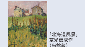
「北海道風景」 草光信成作 (当館蔵)