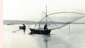
六道湖の四ツ手網漁