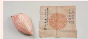
千人針で作った日の丸と鉄兜下に付ける頭巾 (いずれも当館蔵)