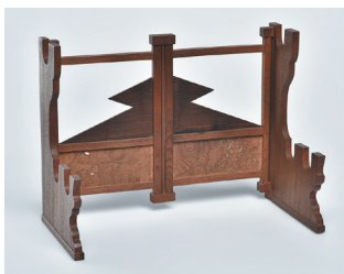
「樺桑富士西行図透刀掛」 小林如泥作(当館蔵)

小林如泥(1753-1813)は、松江藩松平家7代藩主松平治郷(不昧)に仕えた指物師(木工細工の職人)で、透かし彫りや厚材の扱いに優れ、煙草盆や茶箱、建造物の装飾なども手がけました。「その技、神の如し」とたたえられた技は後世の作り手に影響を与えました。本展では、小林如泥の作品と如泥に影響を受けた人々の作品を紹介し、松江が誇る木工文化の素晴らしさを改めて紹介します。