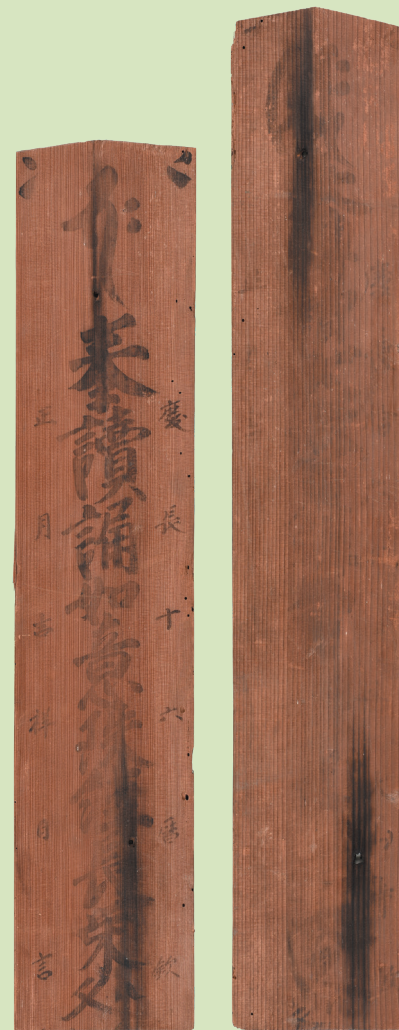
松江城天守祈禱札 (当館蔵、国宝附)