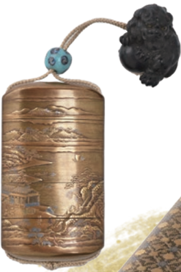
勝軍木庵光英作久能山三保富士産埴清見蒔絵印籠 (当館蔵)