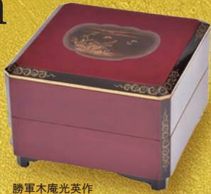
勝軍木庵光英作 「春草蒔絵菓子重」(当館蔵)