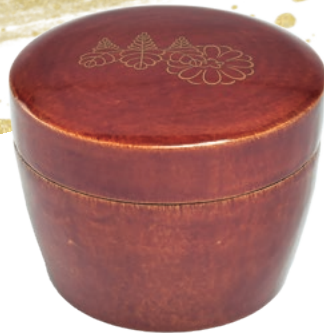
三代小島漆壺齋作 「一閑張菊桐蒔絵茶器」(当館蔵)