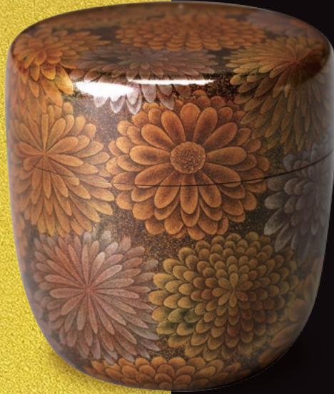
勝軍木庵光英作「菊蒔絵壺」 (京都国立博物館蔵)