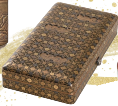
勝軍木庵光英作「蒔絵手箱」 (松江市指定文化財、松江神社蔵)