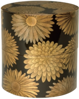
勝軍木庵光英作「菊蒔絵中次」 (島根県立美術館蔵)