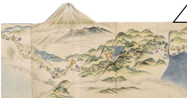
どうちゅうず 道中図（安永10年〔1781〕、松江歴史館蔵）部分