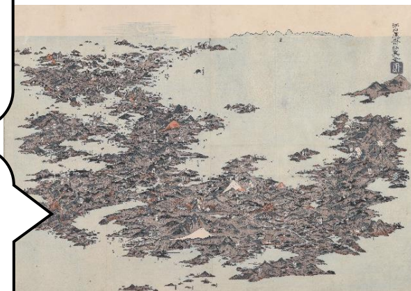
くわがたけいせい にほんめいしよのえ 鉄形蕙斎画 日本名所之絵

江戸時代には印刷の技術が進んで、さまざま な日本図・世界図が流行します。これは浮世 絵師が描いたもので、日本が不思議な形にゆ がんでいます。