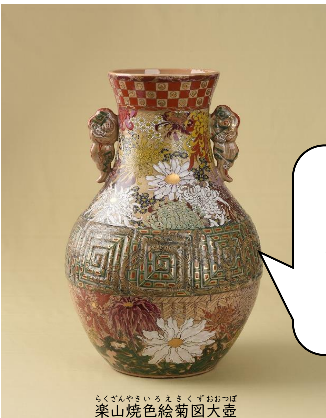
らくざんやきいろえきくずおおつぼ 楽山焼色絵菊図大壺

このつぼのよう に、とてもはな やかな絵 え 付けが されているもの もあるんだ。