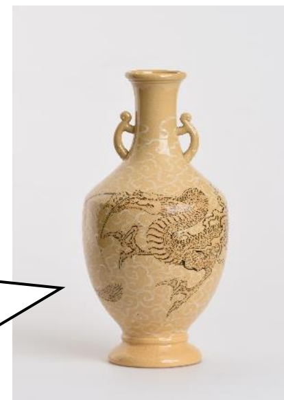
ふ じ な やきりゆうずかびん 布志名焼龍図花瓶

まつえ たまゆちよう つく 松江のなかでも玉湯町あたりで作られていた ふ じ な やき しゆるい きいろ 布志名焼という種類のやきものだよ。黄色い のがとくちょうの1つなんだ。