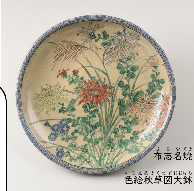
ふじなやき いろえあきくさずおお鉢 色絵秋草図大鉢

それぞれの季節 きせつ にさく はな 花 や、お正月 しょうがつ などの季節 きせつ の 行事 ぎょうじ に かんけい 関係するものがやき ものに えが 描かれることもある んだよ。