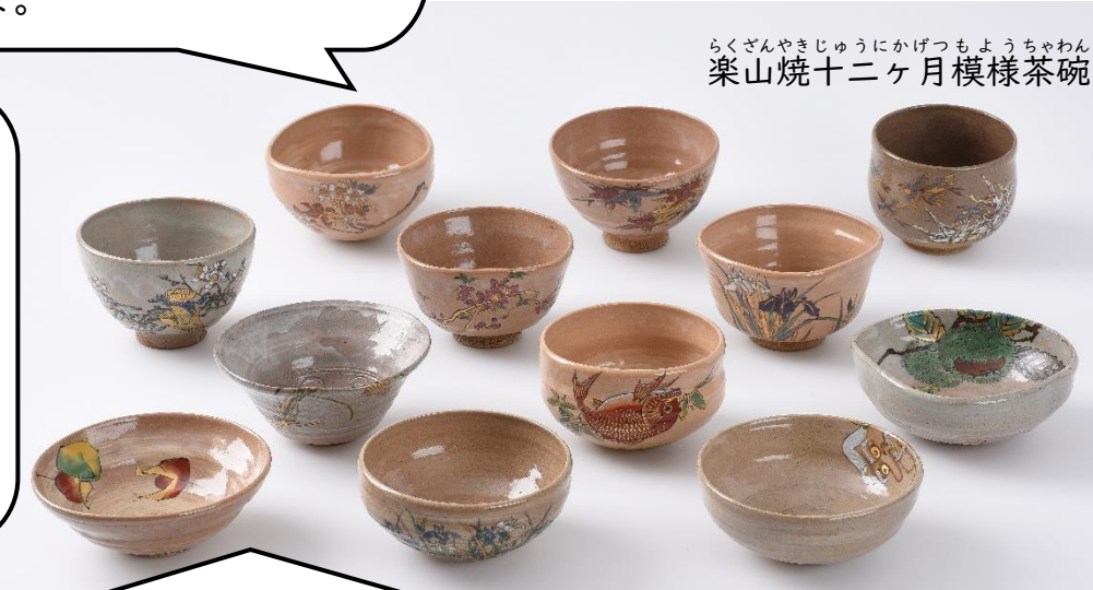
らくざんやきじゅうにかげつもようちやわん 楽山焼十二月模様茶碗