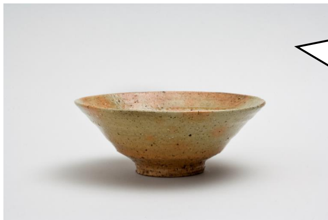
らくざんやき そ ば うつしちやわん 楽山焼蕎麦写茶碗

まつえ らくざんがま ばしよ つく 松江の楽山窯という場所で作られたちやわん だよ。つぶつぶのすな 砂がまじったねん土がつか わ れることが多いのがとくちょうなんだ。