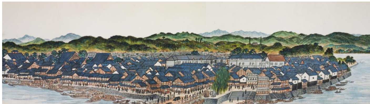
堀芙峯筆 雲州松江風景 松江歴史館蔵