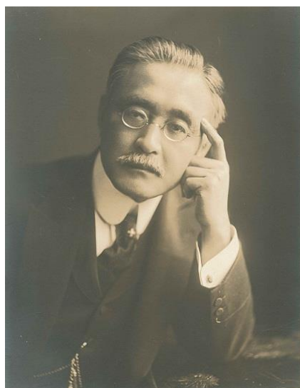
国連事務次長として活躍していた 頃の新渡戸稲造