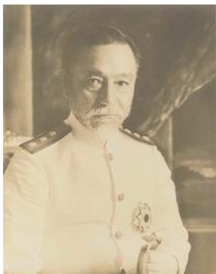
日本海海戦勝利の連合艦隊司令長官 東郷平八郎