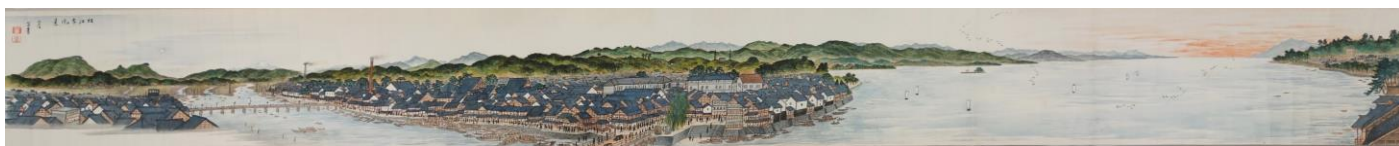
初公開 松江大橋北詰から望む昭和 6~9 年頃の松江城下

明治維新後、松江藩士の家系から特異な 3 人の芸術家が生まれました。島根県で初めて美術学校を開いた堀櫟山 ほりれきざん 、その息子でアメリカ・ニューヨークにおいて写真家として成功した堀市郎 いちろう 、櫟山の弟で昭和初期の松江を描き、漢詩結社「剪淞吟社」 せんしゅうぎんしゃ を率いた堀芙峯 ふほう です。この 3 人の作品を一同に展示します。