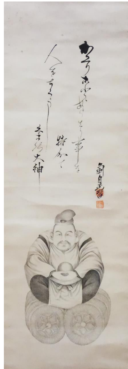
初公開 櫨山のデッサン